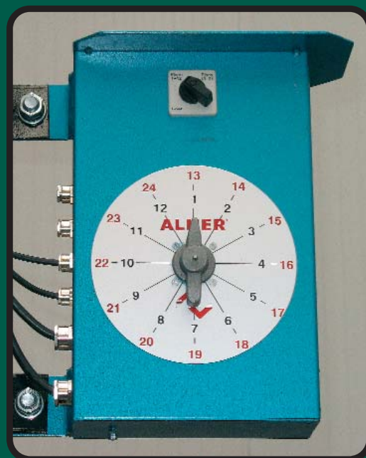
Selector de Paradas / Stop Selector:

Mecánico: Hasta 24 paradas Digital: Hasta 99 paradas